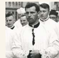
Číhošťský farář Josef Toufar zemřel 25. 2. 1950 na následky brutálních výslechnů Státní bezpečnosti