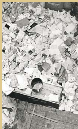
Útok proti klášterům znamenal rovněž nevratné kulturní ztráty (klášter Kadaň, 1950)

Jeho součástí byla násilná izolace biskupského sboru od věřících, uvěznění či internace biskupů, přerušování diplomatických styků s Vatikánem a politické monstrprocesy. V prvním z nich byli souzeni představitelé mužských řeholí a katoličtí teologové a byl doprovázený propagandistickou kampaní