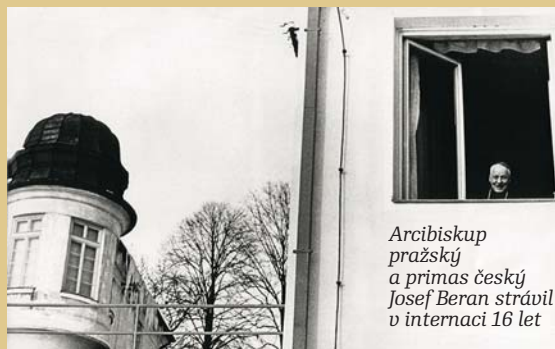
Arcibiskup pražský a primas český Josef Beran strávil v internaci 16 let

Pro československé komunisty představovala zásadní překážku pro totalitní režim římskokatolická církev, která se v podmínkách pounorového Československa vlastně ocitla v postavení zajatce. Věřící i kněží žili v režimu, který proti nim v podstatě vedl zákeřný vícegenerační boj. V tomto zápase krivícím charaktery se pouze měnily prostředky nátlaku ze strany režimu. Ačkoli se tato složka novověkých českých dějin týkala velkého množství lidí a zanechala mnoho morálních a materiálních škod, nebyla veřejností po roce 1990 ještě komplexnějším způsobem doceněna a reflektována. Cílem výstavního projektu je proto představit odborné a laické veřejnosti hlavní specifika proticírkevního boje komunistického státu, přiblížit analytickým historickým způsobem hlavní rysy nátlaku a vytvořit tak rámec pro hlubší reflexi našich nedávných dějin.