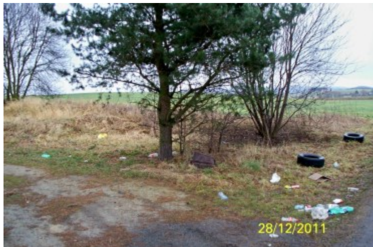
Jeden ze zasláných snímků - Skládka u Němcova lomu

Zároveň je potřeba vzít v úvahu i určitou prodlevu mezi zasláním fotografie a jejím zobrazením a následným řešením. V případě havarijní situace, která nesnese odklad, je nutné kontaktovat Městskou policii (tel. 376 347 207), která bude nápomocna při řešení.