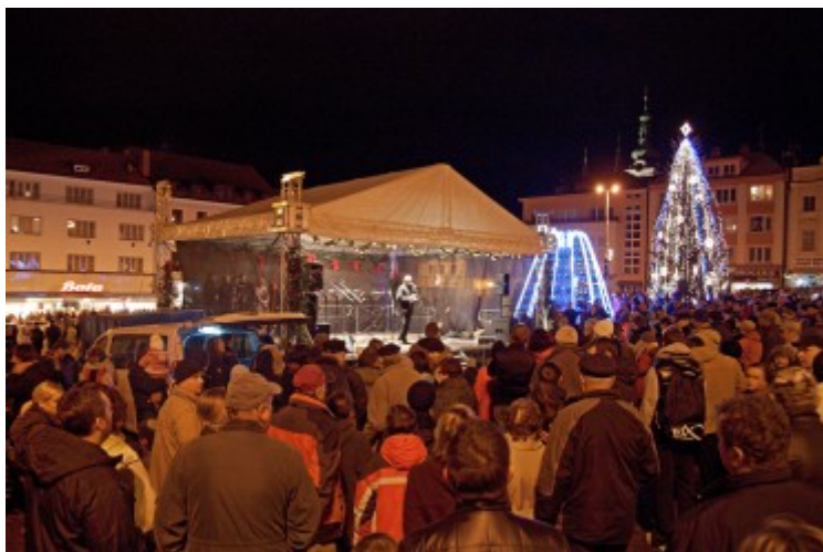
Starosta města při novoročním projevu na klatovském náměstí.