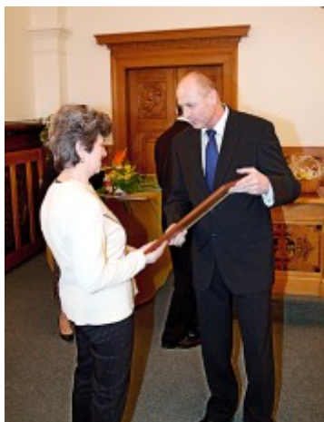
Kategorie „Výroba“: Řeznictví U Šedlbauerů, Klatovy, kpt. Jaroše 109 – MasoWest s.r.o.