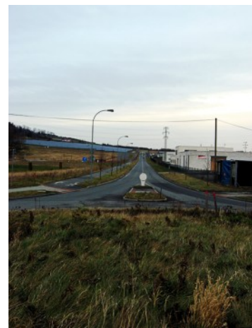
Průmyslová zóna Pod Borem.