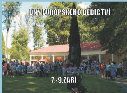
DNY EVROPSKEHO DEDICTVI