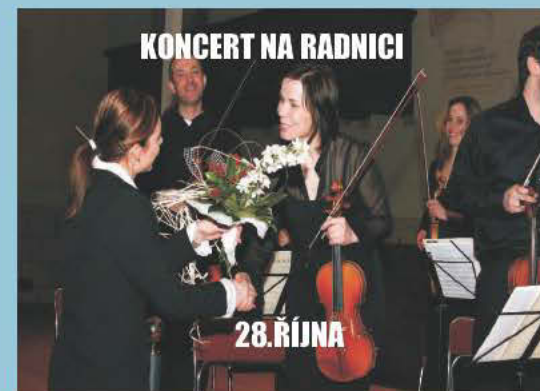
KONCERT NA RADNICI