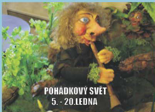
POHÁDKOVÝ SVĚT 5. - 20. LEDNA