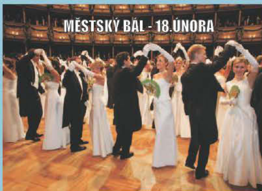
MĚSTSKÝ BÁL - 18. ÚNORA