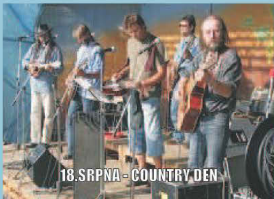
18.SRPNA - COUNTRY DEN