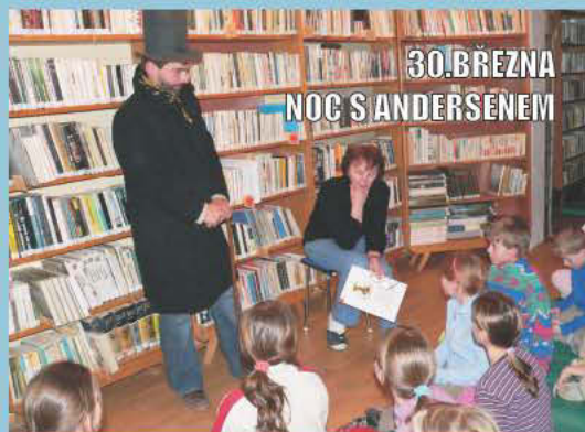
30. BŘEZNA NOC S ANDERSENĚM