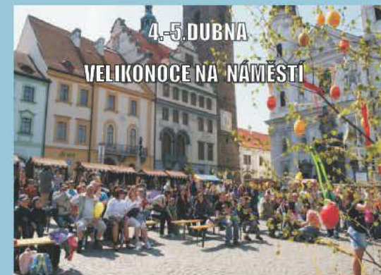
4.-5. DUBNA VELIKONOCE NA NÁMĚSTÍ