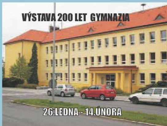
VÝSTAVA 200 LET GYMNAZIA