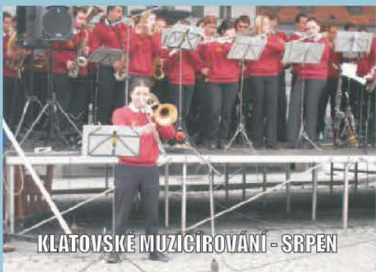
KLATOVSKÉ MUZICIROVÁNÍ - SRPEN