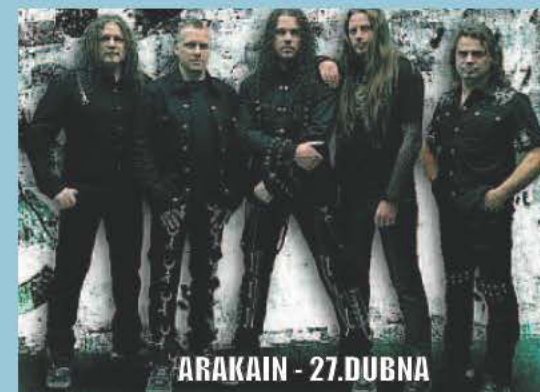
ARAKAIN - 27. DUBNA