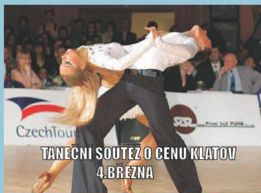
TANEČNÍ SOUTĚŽ O CENU KLATOV 4. BŘEZNA