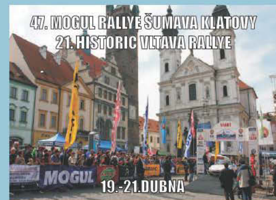
47. MOGUL RALLYE ŠUMAVA KLATOVY 21. HISTORIC VLTAVA RALLYE