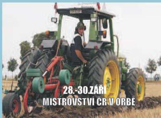
28.-30.ZÁŘÍ MISTROVSTVÍ ČR V ORBĚ