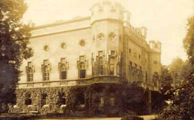
Zámek v první polovině 20. století.