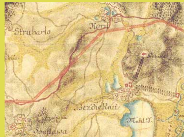
Bezděkov na mapě prvního vojenského mapování z let 1764 - 1768. Na mapě je dobře vidět tehdejší rozloha Bezděkova, rybníky u vsi i alej spojující zámekový areál se dvorem ve Volenově.