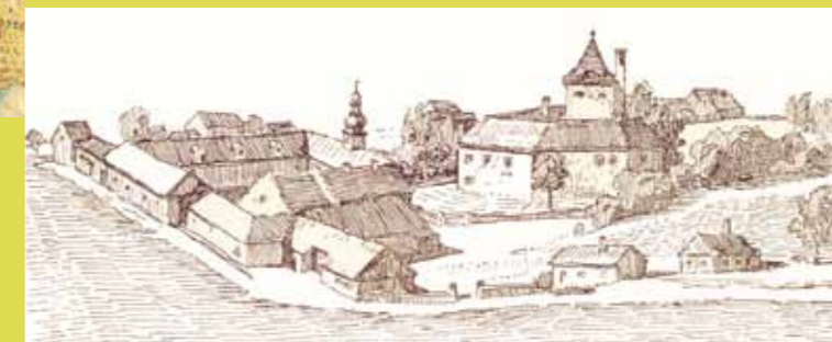
Bezděkov se zámekem v roce 1811. Kresba: Karel Polák.

Po druhé světové válce byl bezděkovský velkostatek příslušníkům rodu Korbů z Weidenheimu znárodněn. Byl pak řízen národní správou a později částečně rozparcelován.