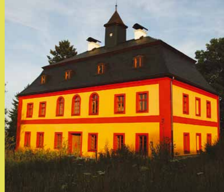
Zrekonstruovaný zámek v Tetětici.

Vítaná - ves založil v roce 1795 majitel bezděkovského panství hrabě Kašpar Heřman Künipl. Její původní název byl Schönwillkomm.