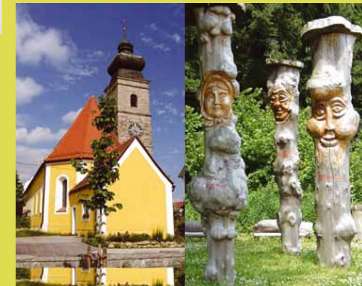
Kostel v Patersdorfu. V Patersdorfu najdete mnoho zajímavostí.