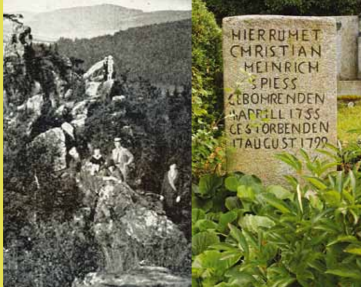
Tupadelské skály byly oblíbeným výletním místem už koncem 19. století. Spiessův hrob na bezděkovském hřbitově.

mentu se dostáváme na tenkou půdu dohadů a pověstí, které říkají, že mezi hrabětem a oběma milenci vznikl milostný trojúhelník.