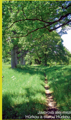
Javorová alej mezi Hůrkou a starou Hůrkou.