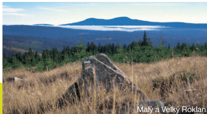
Malý a Velký Roklan