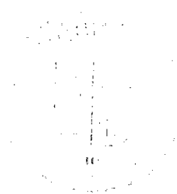
Ing. Vladimír Kroc náměstek hejtmána pro oblast školství a sportu

Úředně ověřené kopie dokladů o nejvyšším dosaženém vzdělání (diplom a vysvědčení o státní závěrečné zkoušce), doklad o průběhu zaměstnání potvrzený posledním zaměstnavatelem a délce pedagogické praxe, životopis (psaný vlastní rukou), koncepci rozvoje Základní umělecké školy, Rokycany, Jiráskova 181 (maximální rozsah 5 stran strojopisu), výpis z rejstříku trestů (ne starší tří měsíců), lékařské potvrzení o zdravotní způsobilosti uchazeče k výkonu vedoucí funkce.