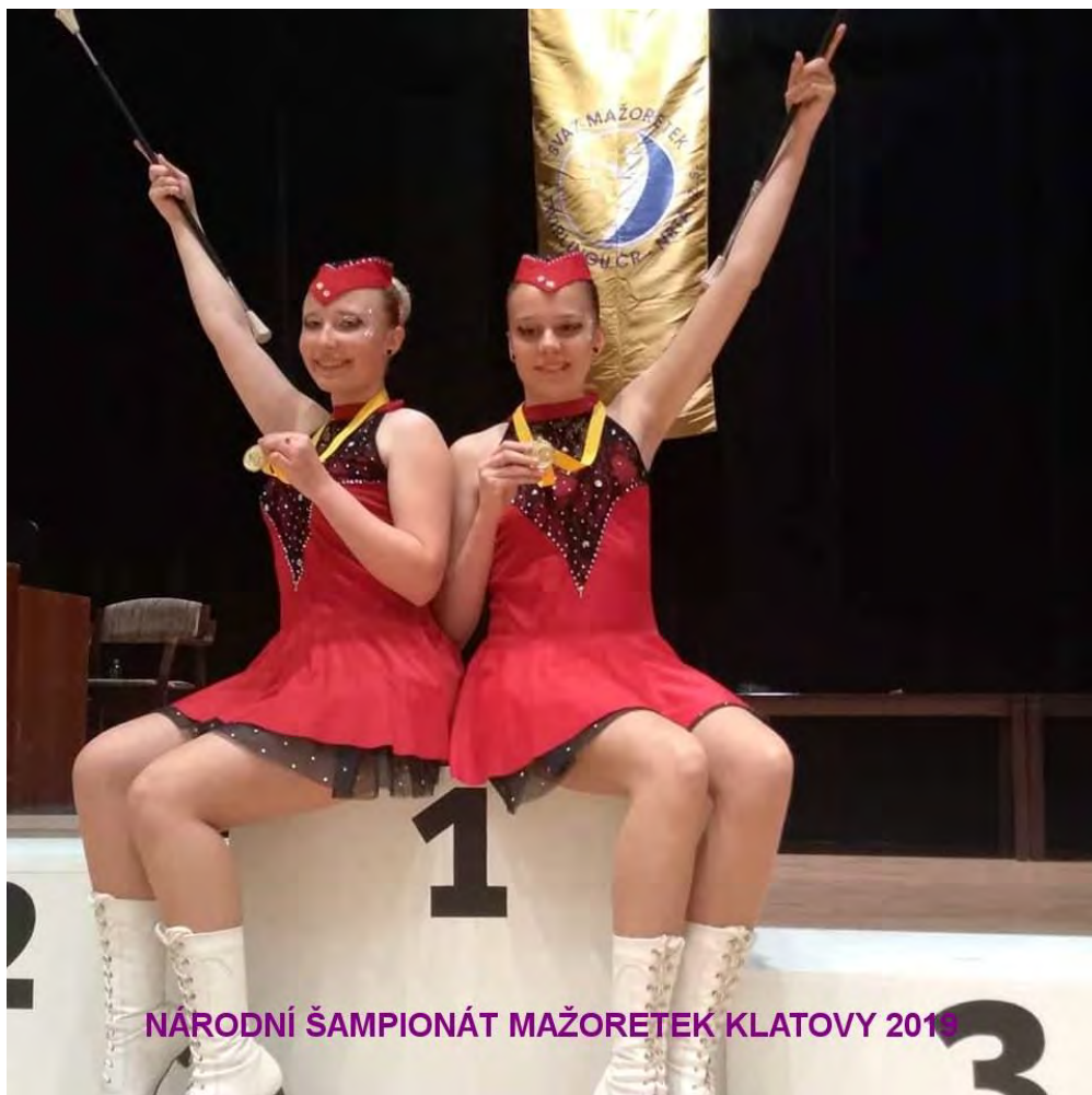
NÁRODNÍ ŠAMPIONÁT MAŽORETEK KLATOVY 2019