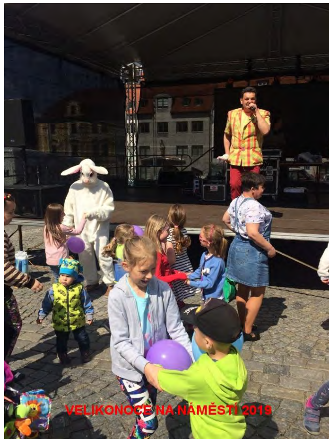
VELIKONOCE NA NAMĚSTÍ 2019