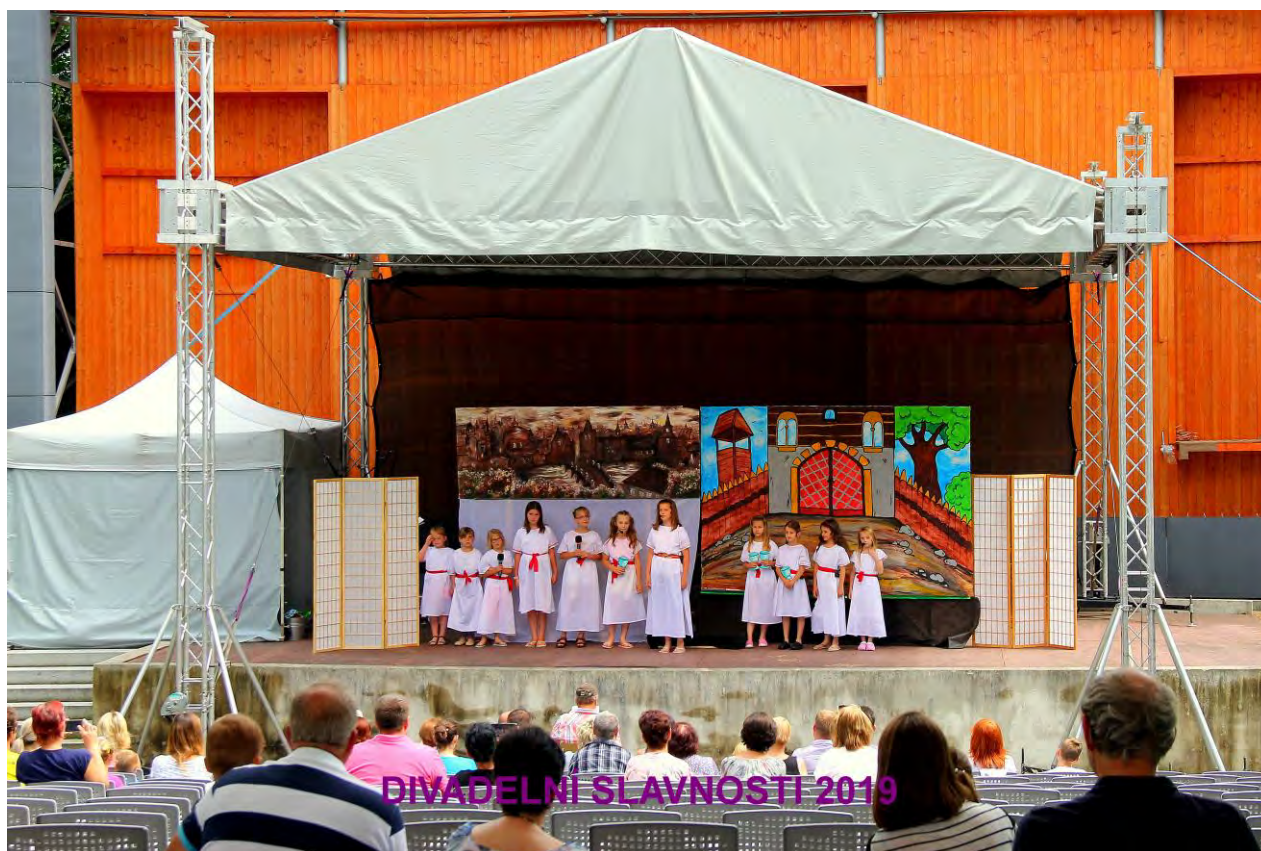
DIVADELNÍ SLAVNOSTI 2019