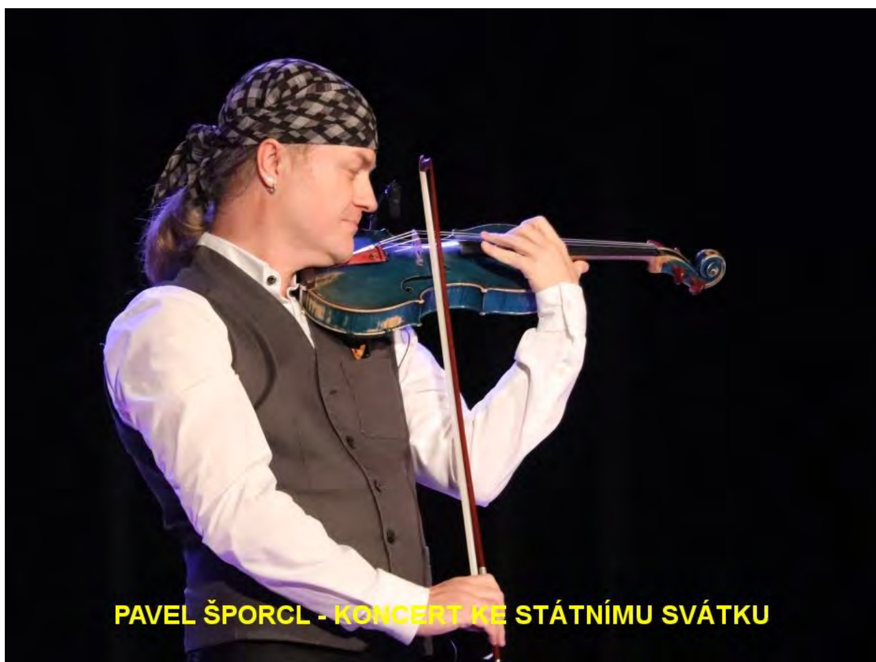
PAVEL ŠPORCL - KONCERT KE STÁTNÍMU SVÁTKU