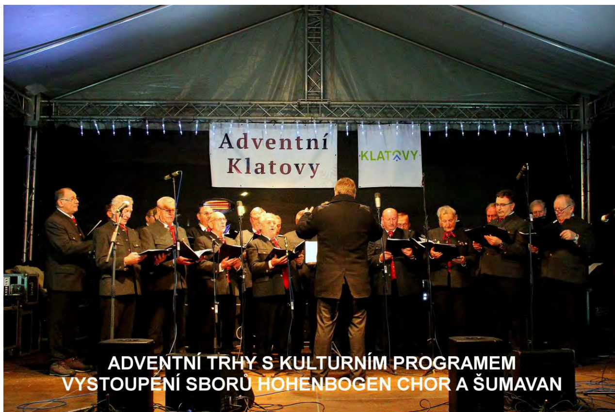
ADVENTNÍ TRHY S KULTURNÍM PROGRAMEM VYSTOUPENÍ SBORŮ HOHENBOGEN CHOR A ŠUMAVAN