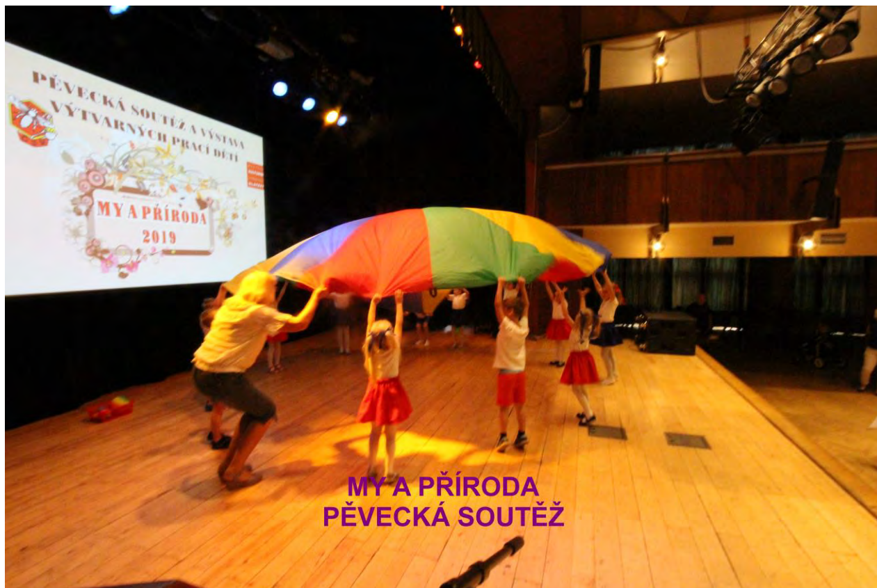
MY A PŘÍRODA PĚVECKÁ SOUTĚŽ