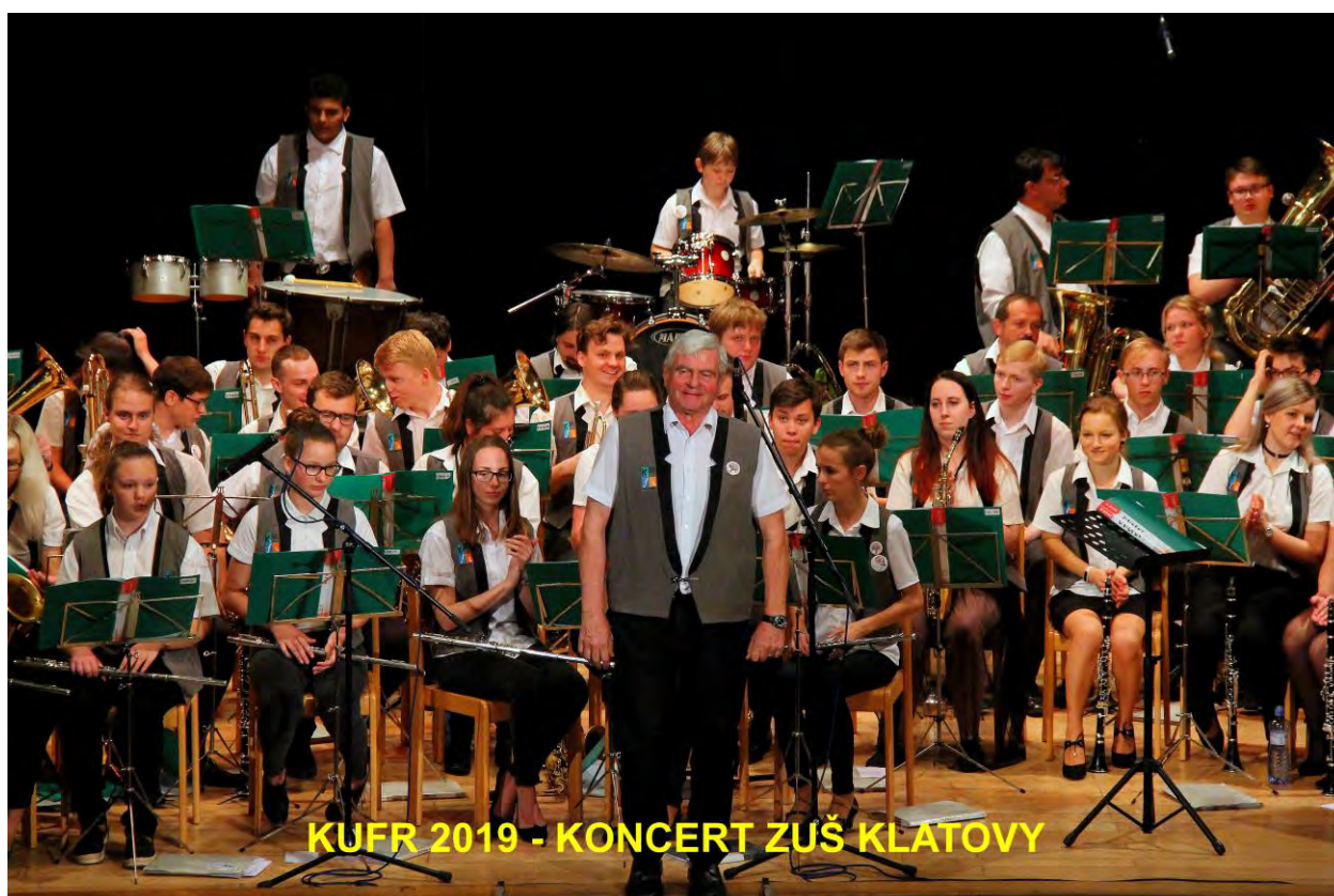
KUFR 2019 - KONCERT ZUŠ KLATOVY