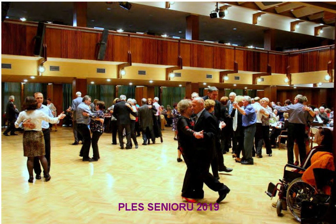
PLES SENIORU 2019