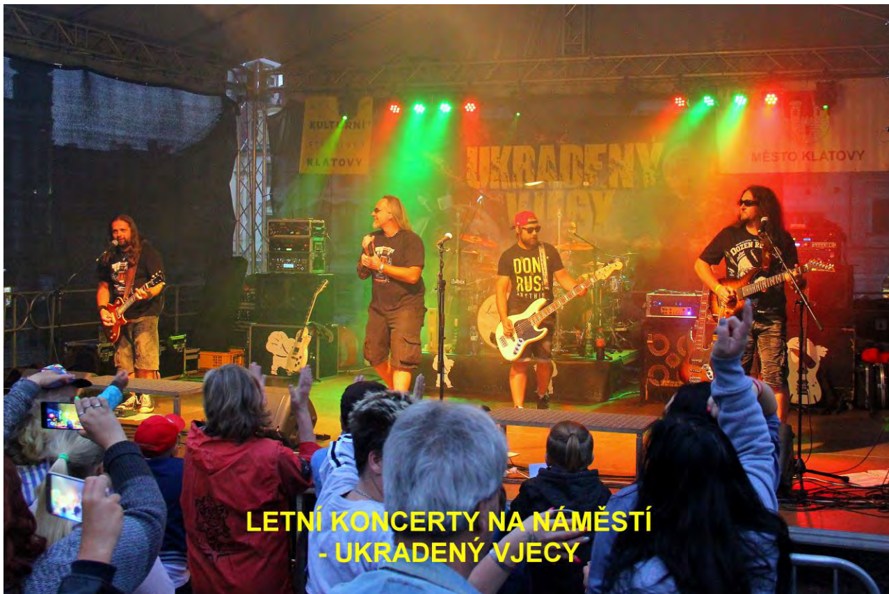
LETNÍ KONCERTY NA NÁMĚSTÍ - UKRADENÝ VJECY