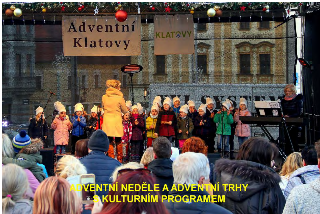
ADVENTNÍ NEDĚLE A ADVENTNÍ TRHY S KULTURNÍM PROGRAMEM