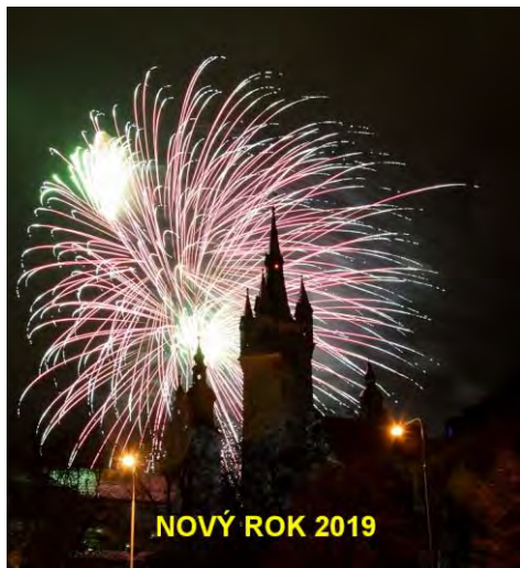
NOVÝ ROK 2019