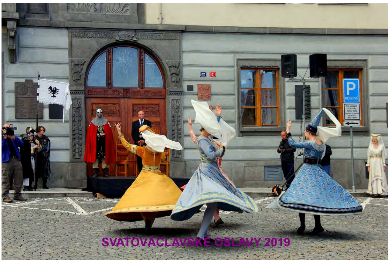
SVATOVÁCLAVSKÉ OSLAVY 2019