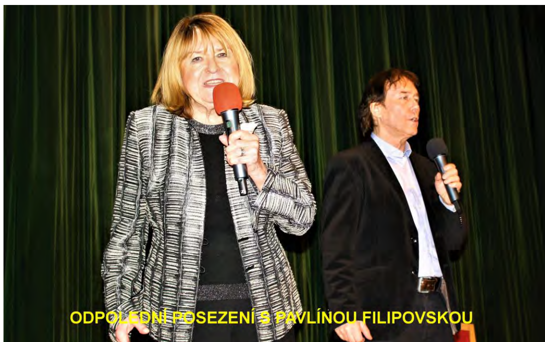
ODPOLEDNÍ POSEZENÍ S PAVLÍNOU FILIPOVSKOU