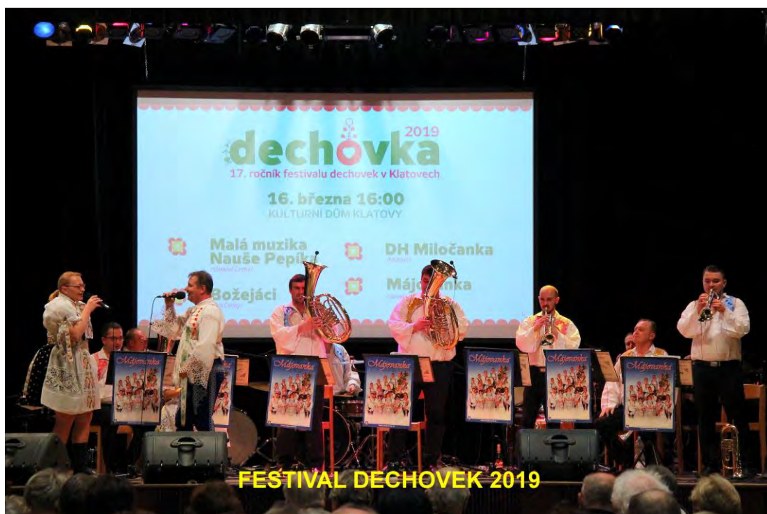
FESTIVAL DECHOVEK 2019