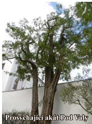
Prosušující akát Pod Valy

V předchozích letech byly z významnějších stromů odstraněny např. vrba u studánky pod nemocnicí, vrba v parku Pod Valy, beňovská lípa a řada dalších. V letošním roce byla poražena jedna lípa v aleji mezi Otínem a Předslaví, která představovala vážné nebezpečí pro své okolí, zejména projíždějící vozidla, byly vyporáženy staré nahnílé vrby před budovou Povodí Vltavy, s.p. v Tajanově a řada dalších. V souladu se zákonem o ochraně přírody a krajiny je vždy při odstranění jakéhokoliv stromu nařízena a realizována náhradní výsadba, a to minimálně v poměru 1 : 1, tedy za jeden odstraněný strom minimálně jeden nově vysazený.