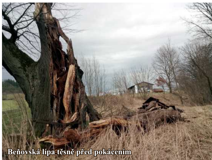
Beňovská lípa těsně před pokácením

V roce 2019 byla provedena „údržba“ tří památných stromů, které rostou na území Klatov. Jedná se o javor stříbrný ( Acer saccharinum ) rostoucí na křižovatce mezi KD Družba a sokolovnou, o dub letní ( Quercus robur ) rostoucí před Zdravotnickou školou a dub letní ( Quercus robur ) rostoucí Na Pazderně. U všech stromů byl proveden tzv. zdravotní řez, kdy byly ořezány suché větve, zarovnány různé zlomy a poškození, byly opraveny bezpečnostní vazby a další opatření pro maximální zachování a udržitelnost stromů.