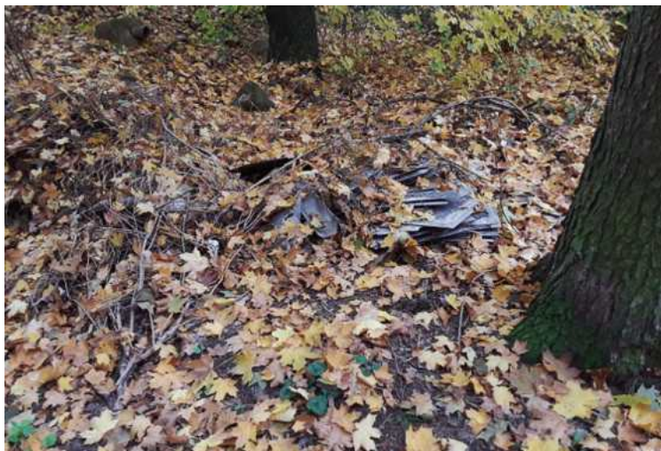
Černá skládka střešní krytiny s obsahem azbestu na kraji lesa v Podborské ulici

vedoucí odboru životního prostředí MěÚ Klatovy