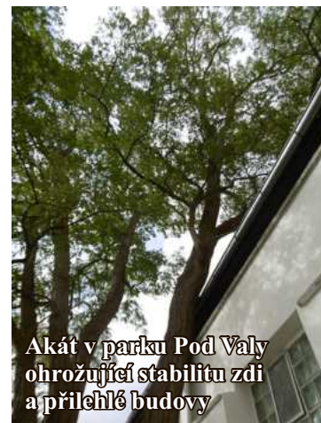
Akát v parku Pod Valy ohrožující stabilitu zdi a přilehlé budovy

V nejbližší době nás mimo jiné čeká likvidace dvou vzrostlých stromů trnovník akát ( Robinia pseudoacacia ) v parku Pod Valy. Jeden z těchto stromů byl již několikrát ošetřen a nadále výrazně prosychá, druhý vážně ohrožuje nově opravenou zeď nad parkem a budovy za ní stojící. I za tyto stromy bude na místě provedena náhradní výsadba stromů nových.