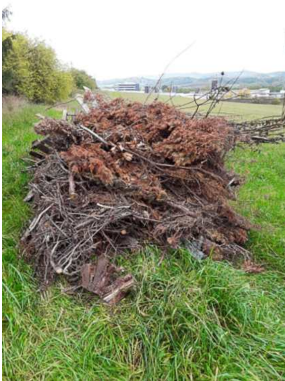
Černá skládka biologicky rozložitelného odpadu s příměsí použitých prken a palet na poli na konci Borské ulice směr zahrádkářská kolonie Markyta

Pravidelně v jarním a podzimním období, podle předem stanoveného a oznámeného scénáře, rozmísťuje město Klatovy prostřednictvím odpadové společnosti velkoobjemové kontejnery, do kterých mohou občané města odkládat objemný odpad ze svých domácností. I tato služba je pro občany města bezplatná. Bohužel se stále objevují případy, kdy i přes veškeré možnosti, které v odpadovém systému město nabízí, dochází ze strany fyzických i právnických