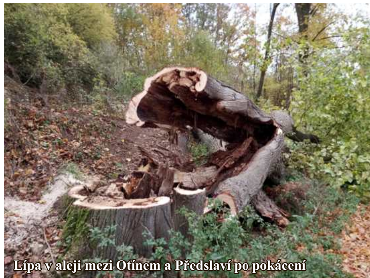
Lípa v aleji mezi Otínem a Předslaví po pokácení

našeho města, pohybující se na veřejném prostranství v jejich okolí. Po pečlivém zvážení kompetentních pracovníků, někdy i na základě podpůrného znaleckého posudku, dochází k odstranění takových stromů.