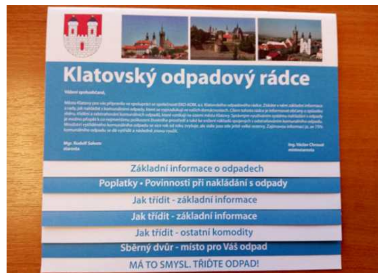
Brožurka - Klatovský odpadový rádce

Klatovský zpravodaj. Vydává město Klatovy, náměstí Míru 62, 339 01 Klatovy.