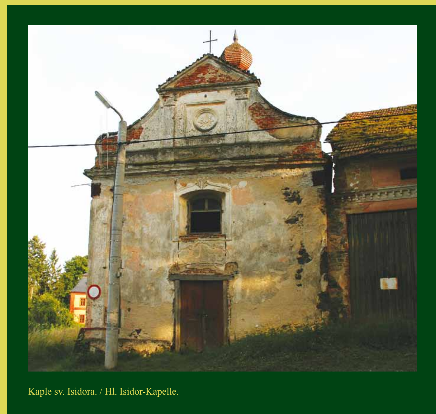
Kaple sv. Isidora. / Hl. Isidor-Kapelle.

Zámek byl vybudován přímo v poplužním dvoře, který stavebně uzavíral. Za ním se nacházela ještě zahrada s parkem. Za zámkem se naskýtá pěkný pohled do okolní krajiny, na nedaleké obce a šumavské panorama. Zámek tvoří jednoduchá budova o rozměrech zhruba 21 x 12,5 m, kterou kryje mansardová střecha s čtyřbokou plechovou věžičkou.