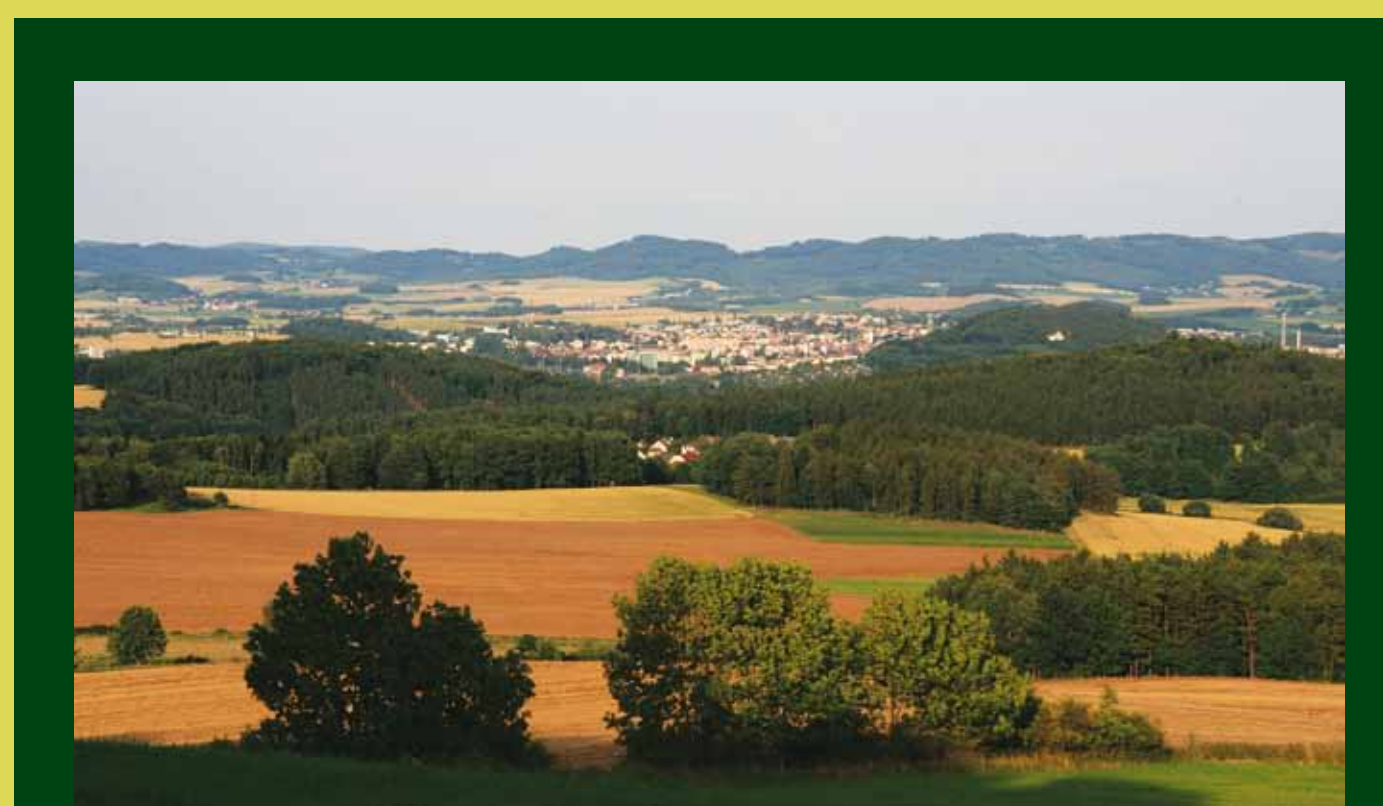
Pohled na Klatovy od zámeckého parku. / Blick vorbei am Schloss auf Klatovy (vom Park aus gesehen).