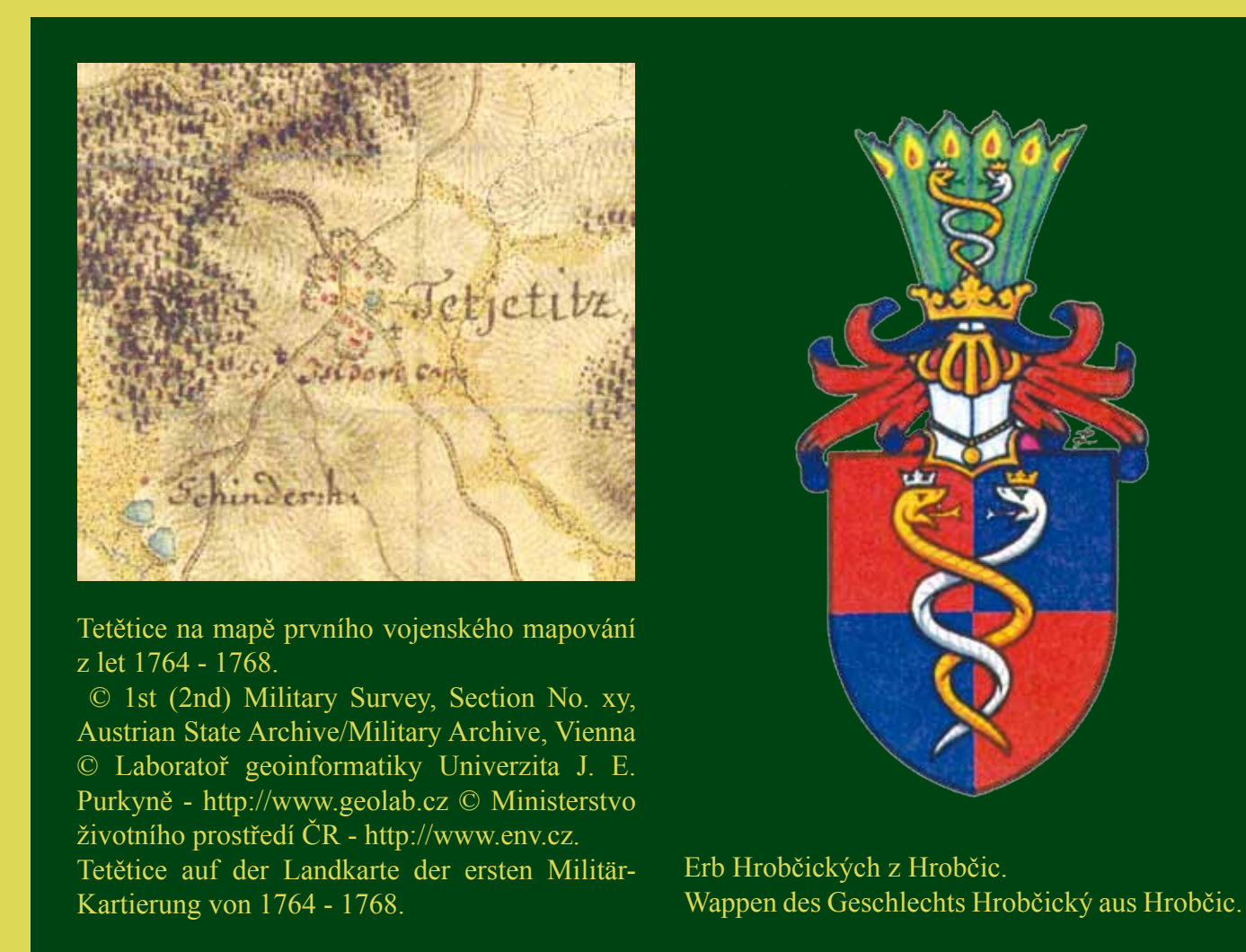
Tetětice na mapě prvního vojenského mapování z let 1764 - 1768.