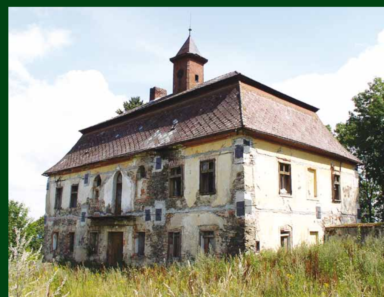
Zámek před rekonstrukcí. / Schloss vor der Rekonstruktion.